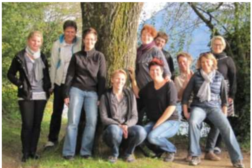
Weiterbildungsweekend in Weggis